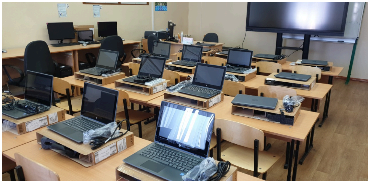
Центр «Точка роста» естественно-научного и технологического направлений (2 кабинета: кабинет физики, кабинет химии и биологии)